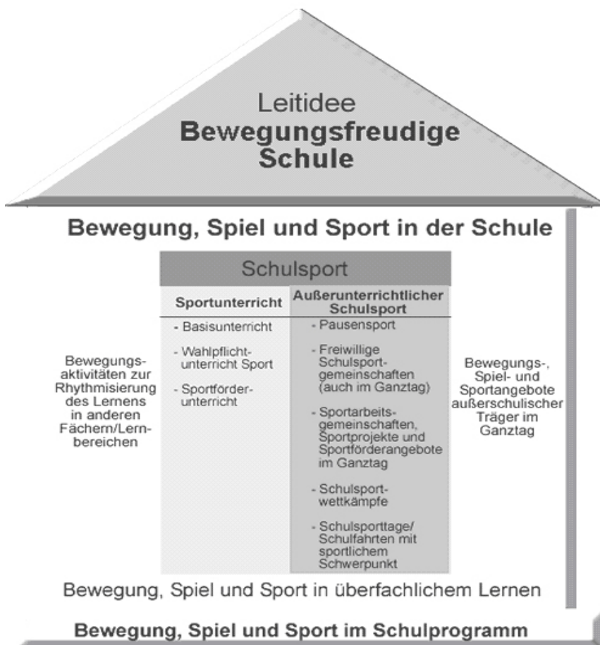
Abb. 2: Bewegungsfreudige Schule NRW 2004

Damit liegen nun zwei Konzeptionen für die außerunterrichtlichen Angebote in der offenen Ganztagschule vor: einmal die außerunterrichtlichen Angebote des Schulsports im Rahmen der staatlichen Lehrplanvorgaben, zum anderen das außerunterrichtliche BeSS-Angebot des LSB NRW im Rahmen der Handlungsfelder für eine Kinder- und Jugendhilfe.